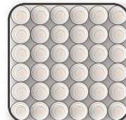
コイル配列イメージ図