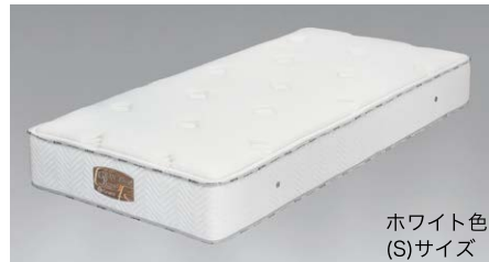
ホワイト色 (S)サイズ