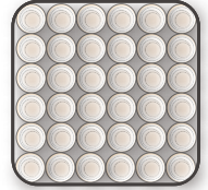
コイル配列イメージ図

表面布 防ダニ抗菌防臭わた:10mm ウレタンフォーム:8mm ウレタンフォーム:16mm 不織布 フェルト:20mm 並行配列ポケットコイル:H140mm フェルト:20mm 不織布 ウレタンフォーム:16mm ウレタンフォーム:8mm 防ダニ抗菌防臭わた:10mm 表面布