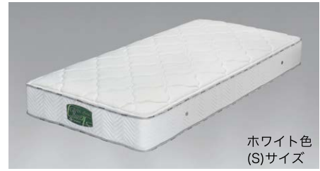
ホワイト色 (S)サイズ